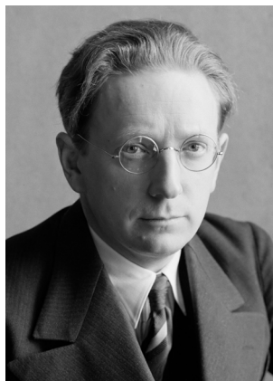
Jón Leifs (1934)

Reim-Tanz-Lieder in einer Bearbeitung von Jón Leifs (Opus 11), ursprünglich für Klavier. Auffällig an den Reim-Tanz-Liedern ist ihr archaischer Charakter und Taktwechsel zwischen Zweier- und Dreier-Takten.