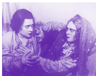
Fotografie aus der Original-Produktion von «Lady Macbeth von Mzensk»

Das Ehepaar Irène und Frédéric Joliot-Curie entdeckt die künstliche Radioaktivität.