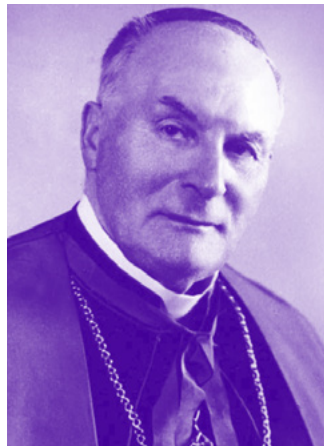
Kardinal Michael von Faulhaber

Erstausgabe von Hans Falladas Gefängnisroman «Wer einmal aus dem Blechnapf frisst»